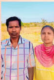
Br. വിജയ് സുനിൽ ഒരു മുഖ്യപ്രഭാവ്