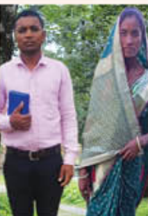
Br. സോമനാഥ് അനിയ ഒരു മുഖ്യപ്രഭാവ്