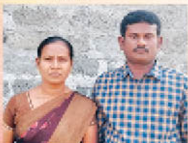
Br. ബൊസ്റ്റു ഡോൾ & സന്ധ്യ ബെലഗാന