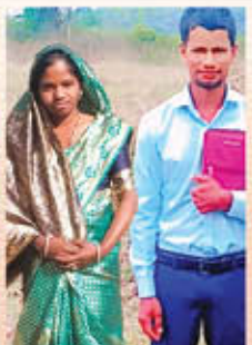
Br. രാമേശ്വരൻ സാമുവേൽ ഒരു മുഖ്യപ്രഭാവ്