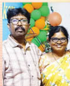
Br. രാജീവ് ബെ & നാഹേല ആന്ധ്രപ്രദേശ്