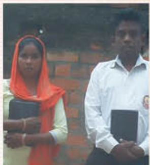
Br. സോമനാഥ് അനിയ ഒരു മുഖ്യപ്രഭാവ്