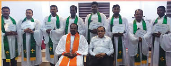
സഭാ ശുശ്രൂഷകളും മിഷനറിമാരും →