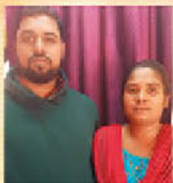
Br. മിബിൻ സി. എസ് & ബിവി മിബിൻ കർണ്ണാടക