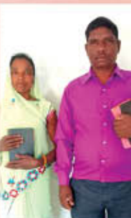
Br. രാജീവ് അനിയ ഒരു മുഖ്യപ്രഭാവ്