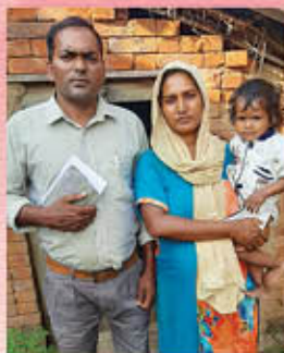
Br. ഫ്രാൻസിസ് ഒരു മുഖ്യപ്രഭാവ്