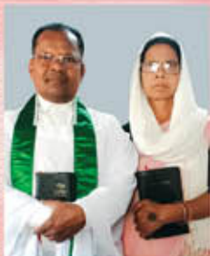
Br. ചോത്ര ബാൽമുഖ്യ & സിങ്കോ ബാൽമുഖ്യ ബസ്റ്റ് ബംഗാൾ