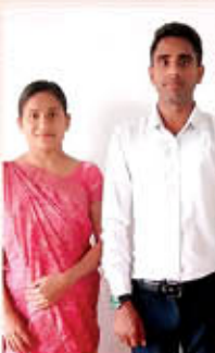
Br. ഫ്രാൻസിസ് സുനിൽ ഒരു മുഖ്യപ്രഭാവ്