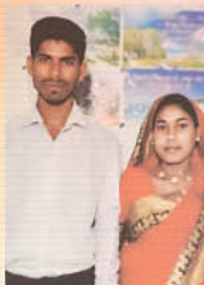
Br. ദിനേശ് സാമുവേൽ ഒരു മുഖ്യപ്രഭാവ്