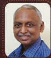
Evg. സോളോ ഫിലിപ്പ്

ദാനിയേൽ - വെളിപ്പാട് താരതമ്യ പഠനം, സുവിശേഷങ്ങൾ, മരണാനന്തരം എന്ത്?, ഗലാത്യലേഖന പഠനം, ശിഷ്യത്വം, ട്രിപ്പിൾ ബി എന്നീ വിഷയങ്ങൾ ആസ്പദമാക്കിയുള്ള ബൈബിൾ സ്റ്റഡിയാണ് ക്രമീകരിക്കുന്നത്.