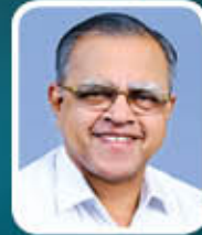
Dr. വി. പി. അന്ത്യ വലയിൽ