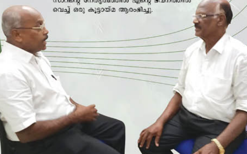
(ശേഷം പേജ് 28 - ൫)