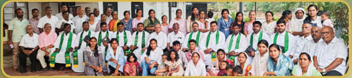
സമർപ്പണശുശ്രൂഷക്ക് ശേഷം പ്രവർത്തകരോടൊപ്പം