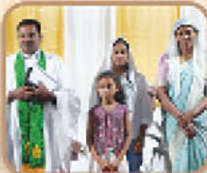
Dn. ധീരഞ്ജൻ & ഫാമിലി