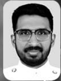
Rev. ബേബിൾ ഓർമ്മ