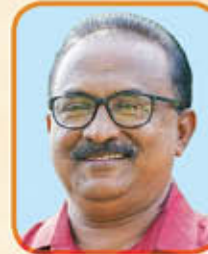
ശ്രീ. എൽജോസ് എം. വി.